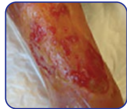
Owrzodzenie tętnicze gołeni

Rana trudno gojąca może mieć również początek w przebiegu powikłanego procesu gojenia rany ostrej - pooperacyjnej. Pacjent zmagający się z taką raną wymaga kompleksowej, długoterminowej opieki.