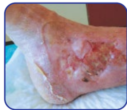
Owrzodzenie żylnie gołeni